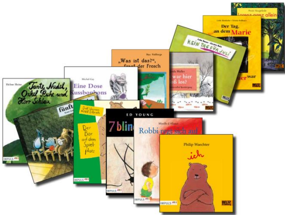
Die 12 Bücher von HIPPY

Das Material des zweiten Jahres bereitet besonders gut auf die erwarteten Vorschulübungen vor. Gewünscht werden noch mehr konkrete Mal-, Zahlen und Buchstaben sowie klassische Vorschulübungen. Alle rückmeldenden Eltern sehen einen hohen Anteil des Programms an einer erfolgreichen Schulvorbereitung und würden es uneingeschränkt weiterempfehlen.